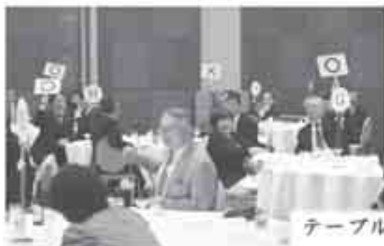
テーブル対抗クイズ大会！