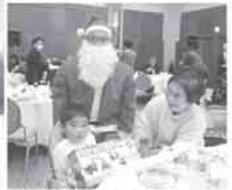
サンタさんからのプレゼント